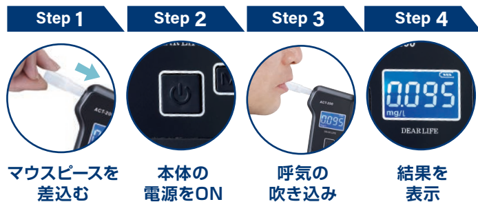
Step 1 マウスピースを 差し込む

マウスピースを差し込み本体の電源を入れて呼気を吹き込んでください。測定回数は約50000回です。