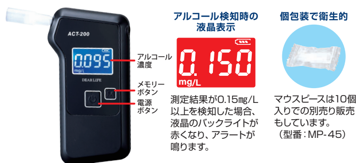
アルコール検知時の 液晶表示